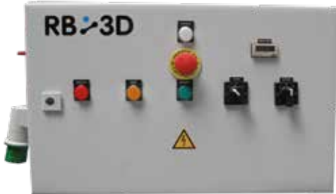
Armoire de commande du cobot et de l'énergie outil