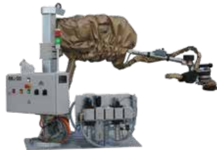
Sur pied lesté ou fixé au sol