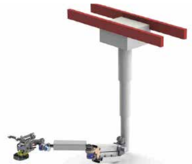
Sur manipulateur aérien