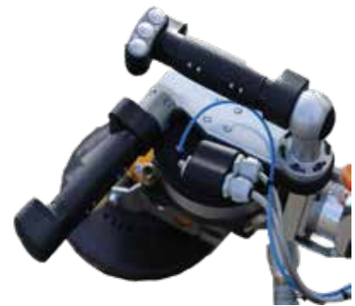
2 poignées perpendiculaires avec présence main IR