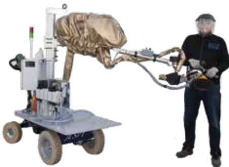
Implanté sur chariot mobile motorisé ou non