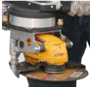
Adaptateur meuleuse avec amortisseur de vibration